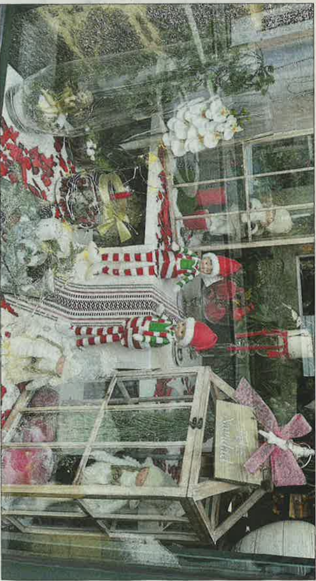
Decoración del escaparate de la Floristería La Primavera, ganador del concurso.