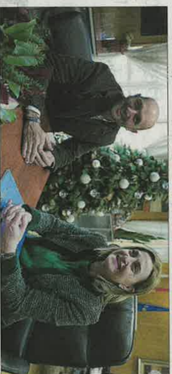
Alejandro Lorenzo y Elena Rivo, reunidos ayer en Porriño.

La conselleira de Promoción do Emprego e Igualdade, Elena Rivo, mantivo ayer una reunión con el alcalde de Porriño, Alejandro Lorenzo, para abordar los programas en materia de igualdad que se desarrollan en la villa del Louro a través de la colaboración de ambas administraciones. Sobre esto, concluyeron que, para optimizar los servicios de búsqueda de empleo, es esencial identificar las necesidades del mercado de trabajo en tiempo real y adaptar la formación y los itinerarios formativos a dichas necesidades, ajustando de manera ágil y efectiva los perfiles con las candidaturas.