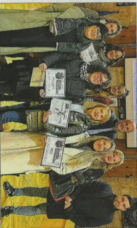
Entrega de premios a los vencedores del certamen.