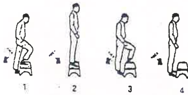
Subida y bajada del banco